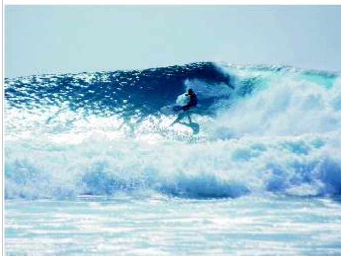
il Surf-spot di Morro Jable a Fuerteventura (Canarie)

Prosegue il nostro viaggio tra le onde del mondo. Questa volta voliamo a Fuerteventura (Canarie). Grazie ai buoni collegamenti con questa isola e al suo clima mite, possiamo partire in qualsiasi periodo dell'anno, anche per solo un week end di puro surf. Io assieme a due amici partiamo un giovedì di fine ottobre da Pisa con rientro il lunedì sera. Atterrati a Fuerteventura intorno a noi un paesaggio lunare fatto di rocce laviche e sabbia. Il clima è gradevole, l'isola è ventosa, gli alisei la dividono in due: la costa controvento con mare agitato e quella sotto vento con acque calme. L'isola è da scoprire, a bordo di una macchina noleggiata partiamo alla ricerca degli spot più famosi. Prima tappa il Cotillo, un piccolo paesino di pescatori. Sulla sinistra si trova una lunga spiaggia con picchi variabili dove la marea svolge un ruolo importante sulla qualità delle onde. Anche se le condizioni sono pessime decidiamo provare lo stesso, troppo forte la voglia di tuffarsi nell'oceano! Dormiamo a Corralejo una cittadina situata a nord dell'isola...davanti a noi l'isola Lanzarote.