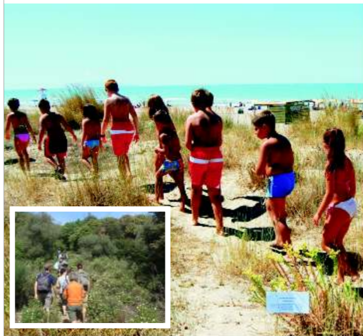
Momenti di escursione al Parco della Maremma e sulle Dune di Marina

A partire dal 25 febbraio fino al 29 settembre, ogni ultimo sabato del mese è in programma un'escursione e a seguire un'osservazione delle stelle con piccola merenda. Gli incontri proposti saranno realizzati da Guide Ambientali - Escursionistiche accreditate a livello Regionale e da personale altamente qualificato sotto il profilo tecnico scientifico per l'osservazione delle stelle, dei fenomeni celesti.