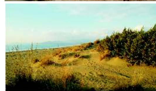
Dune e opere artistiche a Principina a Mare - Grosseto